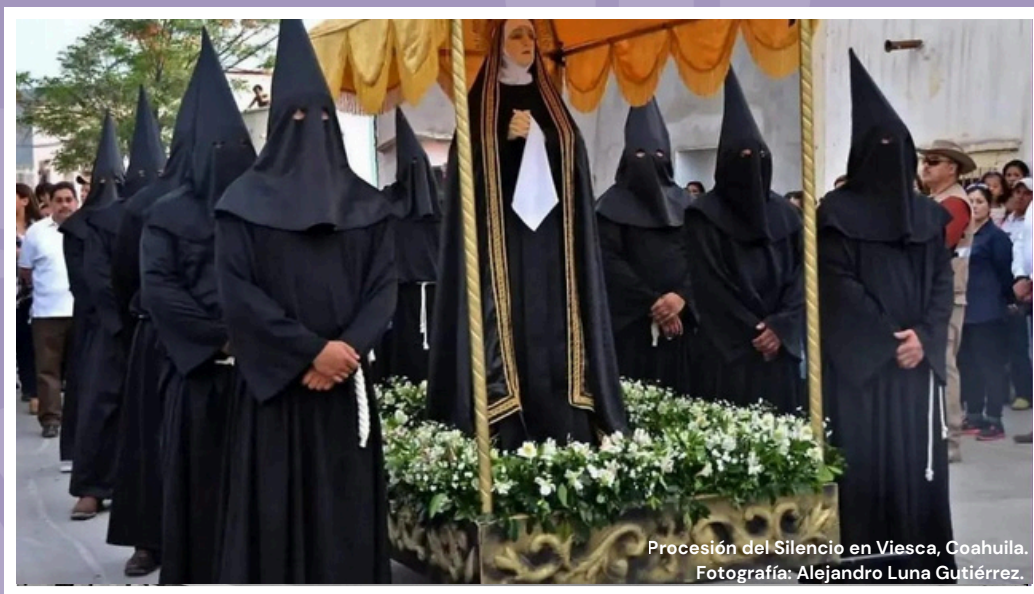
Procesión del Silencio en Viesca, Coahuila.