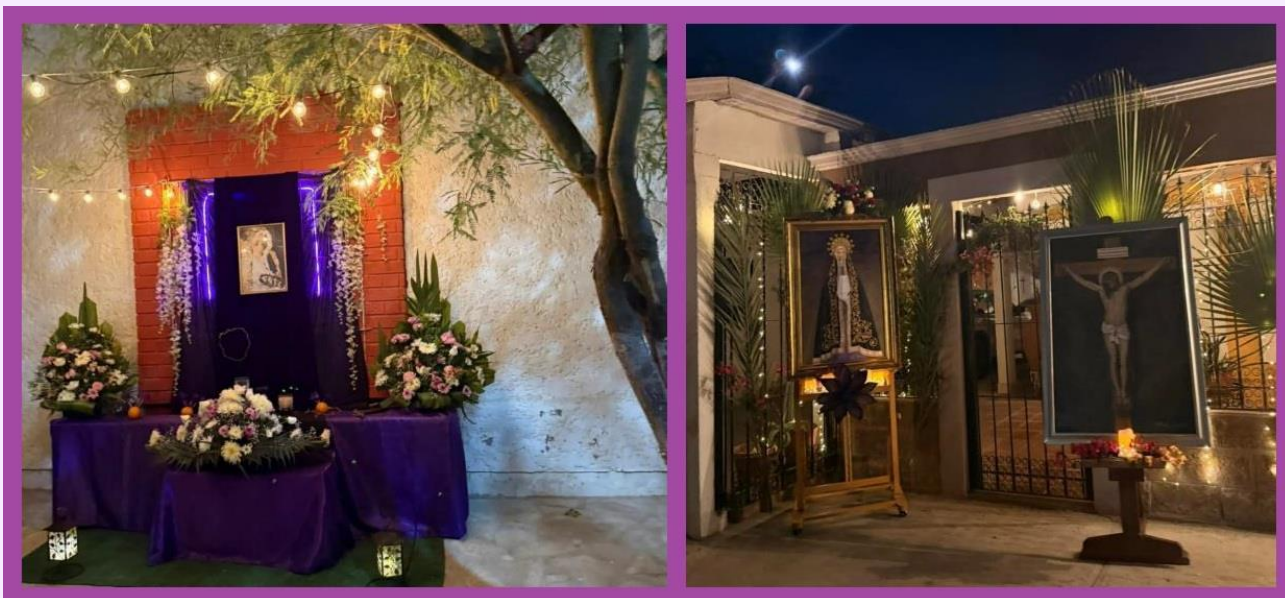
Detalles de los altares que se colocan fuera de las casas e imágenes que pueden verse durante la Procesión del Silencio en Viesca, Coahuila.